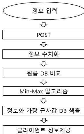
그림 4. 최소최대 추천 알고리즘

당근 마켓은 우리 동네 사람이라는 보증은 해주지만 타지에서 독립을 하는 어린 대학생에게는 안전한 우리 동네는 ‘본가’일 뿐 원룸이 아니다. 에브리타임에서 재학생들끼리 거래하는 중고거래 게시판을 제공하지만 핵심 아이템이 아니다 보니 게시판 형태로 ‘제공’만 할 뿐 관리대상이 아니다.