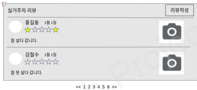
그림 3. AI 추천 프론트 페이지

한 실제로 거주하였던 사실이 증명된 학생들의 리뷰를 통하여 보다 나은 결정을 할 수 있도록 실거주자 리뷰 제공 서비스를 제공한다.