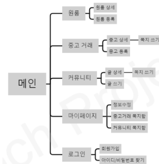
그림 1. 웹 서비스 구성

기존의 플랫폼 서비스의 장점을 최대한 벤치마킹하며 기존 서비스에서는 제공되지 않는 기능들을 추가하여 차별성 및 독창성을 가지도록 하였다. 그림 1은 논문에서 제안하는 토치 시스템의 서비스 구성을 보여준다.