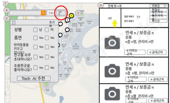
그림 2. AI 추천 프론트 페이지

직방과 다방은 집에 대한 정보를 제공하며 중개인을 연결해주는 구조이지만, 토치 원룸은 독립을 시작하는 대학생들의 입장에서 그들의 미숙함을 보완해주고자 성향을 분석하여 가장 적합한 집을 찾아주는 알고리즘을 개발하였다.