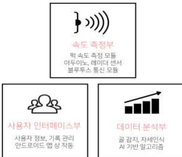
(그림 1) 구조도

아이스하키 슈팅훈련 보조 시스템은 그림 1 과 같이 속도측정부, 사용자 인터페이스부, 데이터 분석부로 이루어져 있다. 그중 사용자 인터페이스부와 데이터 분석부는 안드로이드 앱 상에서 구현된다. 속도측정부는 레이더 센서를 통해서 퍽의 속도를 측정하고 측정된 퍽의 속도를 블루투스를 통해 사용자 인터페이스로 전송한다. 데이터 분석부에서는 센서로부터 블루투스를 통해 데이터를 수신 받아 데이터베이스(DB)에 자동으로 저장하고 퍽 속도의 통계정보가 생성되고 시각화 된다. 사용자 인터페이스부에서는 사용자의 계정, 개인정보, 슈팅 기록 등을 사용자가 실시간으로 확인할 수 있도록 설계되었다.