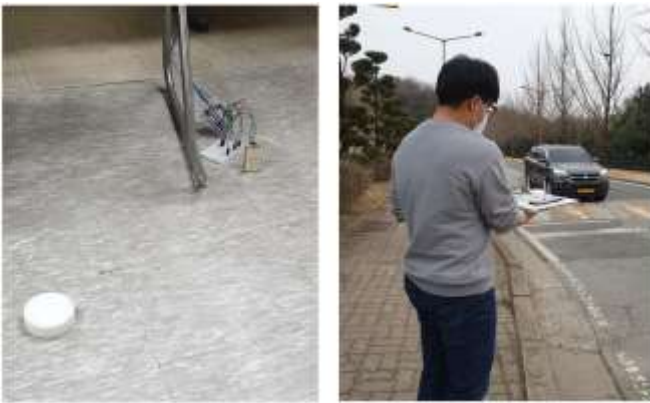
(그림 3) 레이더 센서 속도측정 장면

레이더 센서의 속도 측정은 다음 두가지 방법으로 수행하였다. 첫째, 펍 모형을 3D 프린터로 제작하고 저속(5~10km/h)으로 움직이는 펍의 속도를 측정하였다 (그림 3). 둘째, 다소 빠르게 움직이는 자동차의 속도(30~40km/h)를 측정하였다.