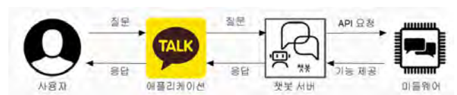
(그림 1) 제안하는 시스템 개요도