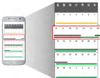
(그림 9) 현황을 살펴볼 수 있는 배송관리 시스템

그림 8에서 확인할 수 있는 것처럼, 소비자는 스마트폰에 구현된 배송관리시스템에서 3월 첫 주가 노란색 화면으로 나타난 것을 확인할 수 있다. 이때에는 아직 주문한 두 곳에서 모두 마스크가 도착하지 않았고, 25개가 남아있던 마스크를 하루에 하나씩 소비하면서, 마스크 재고가 소비자가 설정한 11~20개 내외로 떨어졌기 때문이다.