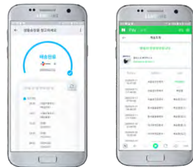
(그림 3) 도착 여부만 파악할 수 있는 기존 배송지킴이의 샘플화면과 네이버 쇼핑 배송조회

사실 이미 온라인에서 배송추적은 가능하다. 우체국, 네이버 쇼핑, CJ대한통운, 알라딘, 쿠팡, 티몬 등 대부분의 온라인 쇼핑몰은 결제 후 상품 출하, 배송, 도착까지 모든 과정을 제공하고 있다.