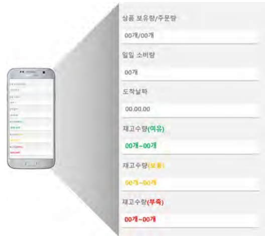
(그림 5) 이용자 자체기입단계 시안

배송관리시스템에서 정보를 추출하는 기본적인 방식은 리멤버나 기존의 배송관리 어플처럼 같다. 우선 명세표를 촬영하거나, 배송코드를 바탕으로 정보를 등록할 수 있도록 하였다. 다만 본 배송관리시스템에서는 정보등록 단계 후, 이용자 자체기입 단계에서 몇 가지 사항을 추가했다.