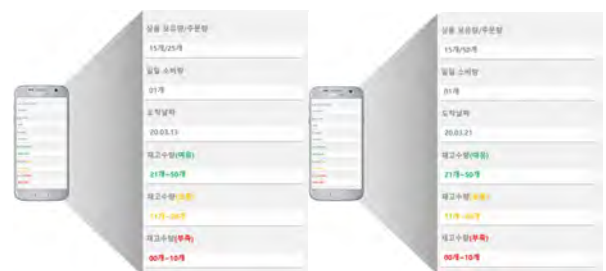
(그림 7) 쿠팡과 네이버쇼핑에서 결제한 정보를 입력하는 과정