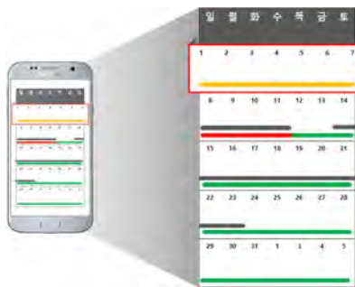
(그림 8) 현황을 살펴볼 수 있는 배송관리 시스템

이에 소비자는 물품을 결제하고 받은 명세표를 스마트폰 카메라로 촬영하여 우선 기본정보를 등록했다. 그리고 소비자는 이용자 자체 기입 단계에서 상품명을 마스크로, 보유한 마스크 수량에 도착한 25개를 추가로 입력했다. 도착 날짜는 예정된 23일로 입력했다. 주문한 상품과 보유한 마스크는 모두 일회용이기 때문에 일일 사용량은 한 개로 설정했다. 그리고 소비자는 재고수량을 설정할 때, 여유를 21개~50개, 보통을 11~20개, 부족을 10개 이하로 설정했다. 이를 바탕으로 구현된 소비자는 쉽게 자신의 마스크 보유량을 파악할 수 있다.