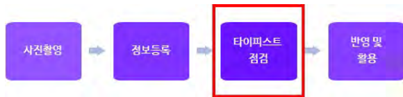
(그림 3) 명함 어플 리멤버의 구성원리

리케이션에서에서 그 방법을 찾았다. 2010에 실시된 명함 어플에 대한 연구가 이루어진 이후, 현재는 다양한 어플리케이션이 제작되며 대중적으로 이용되고 있다. [1] 원리는 이렇다. 우선 어플을 실행하여 휴대폰 카메라로 명함을 찍는다. 그 후 찍힌 사진에서 정보가 추출된다. 취합된 정보는 분야에 따라 보기 쉽게 정리되고 필요에 따라 토론 및 구인 구직과 같은 부가적인 기능까지 제공한다. [2]