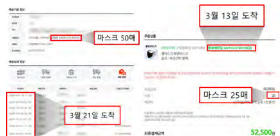
(그림 6) 쿠팡(왼쪽)과 네이버쇼핑(오른쪽)에서 결제한 마스크 수량과 도착 날짜

우선 현재 상품 보유량과 상품명, 상품 도착 날짜와 일일 소비량을 적도록 하였다. 일일 소비량과 상품소비량을 바탕으로 재고 현황도 이용자가 자체적으로 설정할 수 있도록 하였다. 재고 현황은 여유(초록), 보통(노랑), 부족(빨강)으로 나누었으나 범위는 개인에 따라 자유롭게 조정할 수 있도록 하였다. 이 시스템은 배송되는 마스크 수량만 파악하는 것이 아니라 소비자의 재고량과 일일 소비량에 기반하여 재고 현황을 산출하기 때문이다.