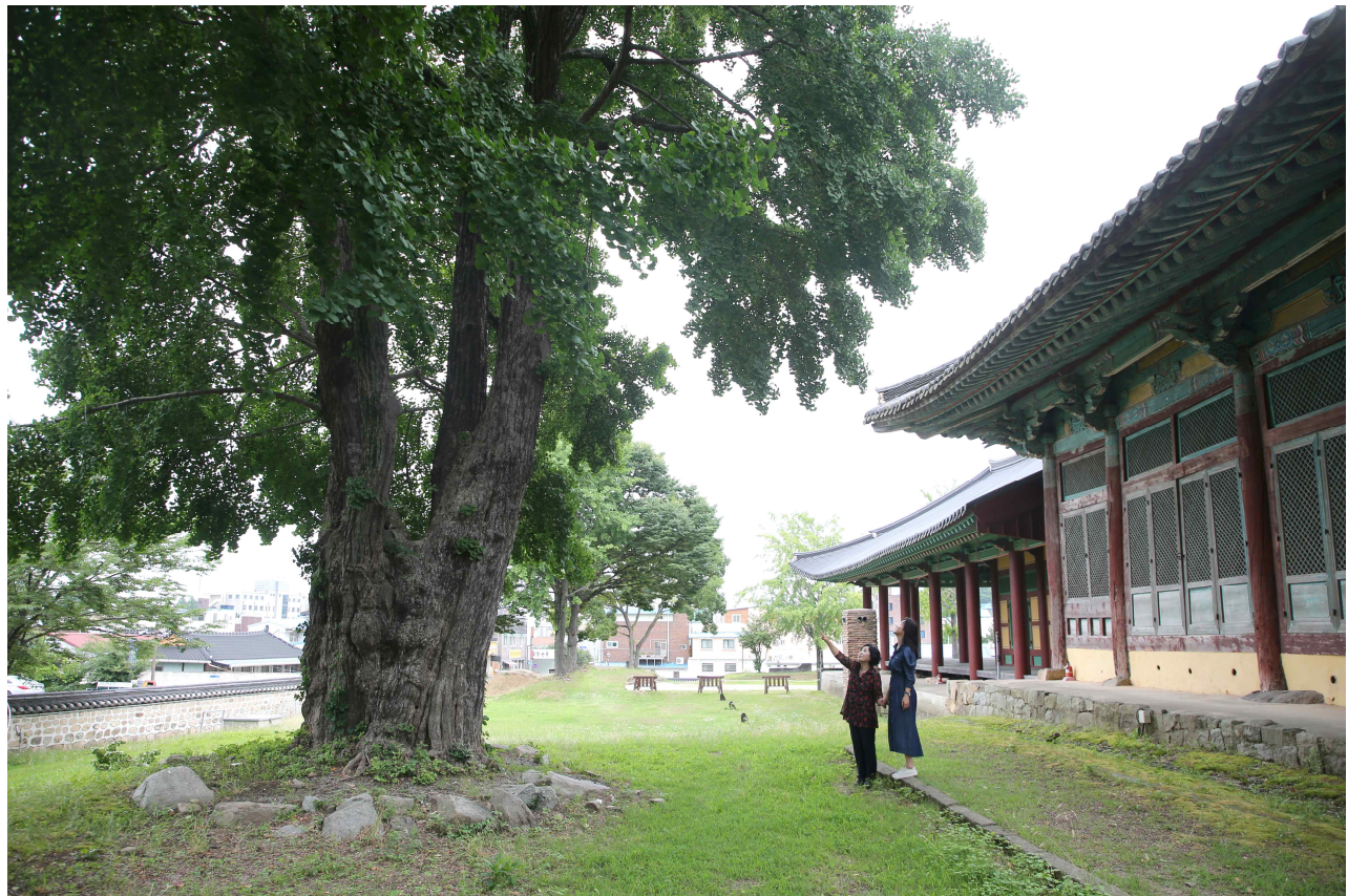
600년 이상 수령의 은행나무