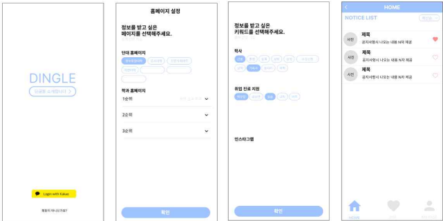
(그림 2) ‘Dingle’ 앱 UI