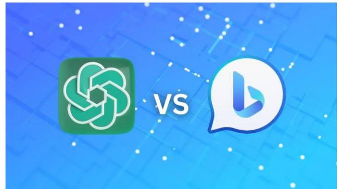
(그림 1) Chat GPT VS Bing.

새로운 텍스트 생성하며, 두 모델은 GPT3.5[1], GPT4[2]를 각각 사용한다. Chat GPT 모델은 Open-AI에서 개발한 자연어 처리 기반의 대화형 인공지능 모델이며, GPT3.5를 사용하여 대화, 질문/응답, 자동 텍스트 생성 등의 응용 프로그램에서 사용된다. Bing은 GPT4를 이용하며, 웹 상에서 정보 검색과 결과를 제공하며, 다양한 정보와 연계가 가능하고 대부분의 정보가 웹에서 가져온 최신 정보이다. 둘 다GPT시리즈를 사용했으며, GPT는 Transformer[3]의 Decoder를 사용하여, 인공지능이 사람과 같이 대화를 하며, 대화를 통해 사용자가 원하는 결론 및 결과를 제공한다.