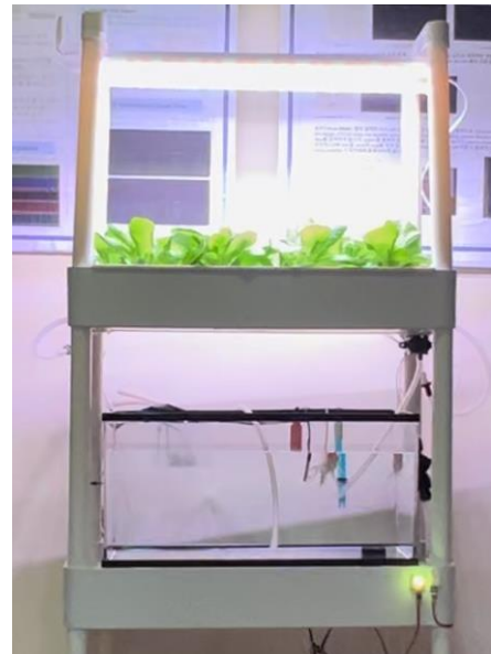
<그림 3. 아쿠아포닉스 시스템 실제 구성사진>

<그림 3>의 경우, 그 날의 수치를 한눈에 볼 수 있고, <그림 1>의 경우, 기간 설정 후 기간 동안의 데이터를 확인할 수 있다.