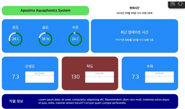
<그림 3. 웹페이지 화면 예시>