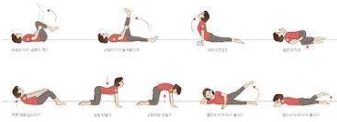
그림 2. 홈 트레이닝 예시