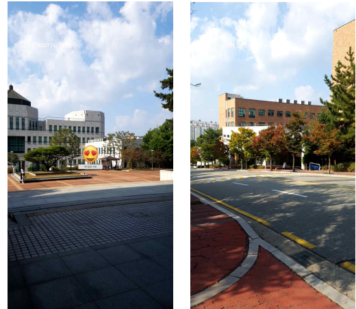
(그림 2) GPS 테스트 결과 화면

AR 콘텐츠가 모델링 되었다면, 필요한 GPS를 가져와야 한다. 디바이스의 카메라를 통해 현재 GPS를 인식하고 저장하기 위해서는 유니티에서 제공하는 'LocationService'를 이용한다. 디바이스가 위치 사용을 허가했을 때, 해당 GPS의 위도와 경도를 저장하는 예외 처리를 통해서 UnityEngine에서 제공하는 text_ui에 위치값을 저장한다. (그림 2)는 특정 위치에서 객체 출력 확인을 위한 테스트 결과 화면이다. 해당 위치를 기준으로 반경을 측정하여 사용자가 반경 내에 들어왔을 때 (그림 2)의 좌측과 같이 해당 위치에 저장된 이모지 객체를 출력한다.