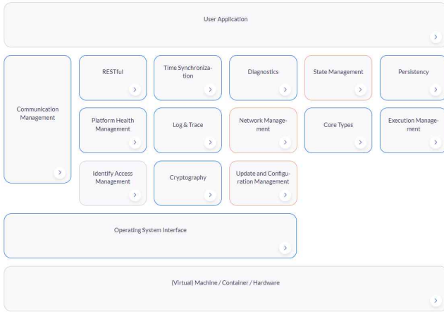
(그림 2) AUTOSAR Adaptive Platform.

[4]Adaptive AUTOSAR는 기존의 AUTOSAR Classic Platform과는 다르게 C++ 객체 지향 언어로 코딩되어 있으며 이에 따라 기존의 다양한 차종과 플랫폼 확장성과 다르게 적응성과 유연성에 강점을 두고 있다. 또한 사용자가 직접 시스템에 필요한 요구 사항에 따라 OS(Operating System)를 선택할 수 있다. 이때 POSIX(Portable Operating System Interface)과 같은 운영체제를 선택할 수 있는데 이 OS를 적용함으로써 기존의 Platform에 비해 뛰어난 HW지원, MMU 및 멀티코어 프로세스가 가능해진다. 또한 유동적 SW의 사용을 통해 차량의 운용 중 SW의 설치 및 업데이트가 가능할 것으로 보인다. 두 Platform은 아래의 <표 1>과 같은 차이점을 가진다.