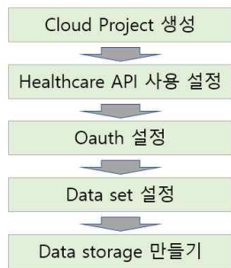
<그림 1> FHIR 저장소 활성화 과정

별도의 크레딧이 필요하다. 다음 과정에서는 Oauth 설정으로 데이터에 대한 접근 범위를 결정하며 이후 데이터 셋과 데이터 저장소를 생성하며 이 스토리지 객체를 선택함으로써 현재 저장된 FHIR 객체를 조회할 수 있다. 저장된 객체들에 대해서는 몇 가지 접근 방식이 제공되고 있으나 Cloud shell을 이용하면 Unix 계열의 인터페이스에 의해 데이터 조작이 가능하다.