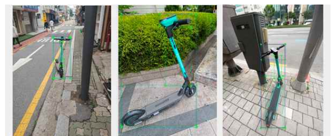
(그림 2) 부분별 라벨링의 예

전동 키포드는 크게 핸들, 바, 발판 3부분으로 나눌 수 있다. 촬영 각도에 따라 전동 키포드의 전체 모양은 크게 변하지만 각 부분은 비교적 일관된 모양을 유지한다. 따라서 제안 방법은 전동 키포드 사진을 (그림 2)와 같이 핸들, 바, 발판으로 나누어 각각 라벨링을 진행하고, 입력 사진에서 핸들, 바, 발판을 각각 탐지하도록 하였다.