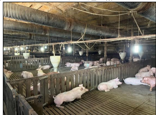
Figure 1 돈사 구조에 따라 카메라를 설치하기 어려운 경우도 흔하다. 위 사진은 핸드폰으로 촬영하였다.

최근 연구 동향에 따르면 개체인식 기술을 활용해 시설물과 엉켜있는 돼지 각각을 식별[1]하여 이 정보들을 양돈에 활용하고 있다. 돼지 우리의 구조에 따라 카메라를 설치하기가 마땅치 않은 경우도 흔하게 발생할 수 있기 때문에 주변 사물과 얽혀있는 돼지들의 경우 개체 식별이 어려워지는데 이에 대한 연구도 진행되고 있다. 딥러닝 기술 중에서도 실시간 처리가 가능한 객체 탐지 방법인 YOLO[2]를 이용해 다양한 각도에서 돼지를 식별하는 기술에 대한 연구도 존재하나, 여전히 상단에 카메라를 설치하여 돼지를 식별하고자 하고 있다. 본 연구에서는 사선 상에 카메라를 설치하여 돼지를 식별하였다.