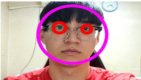
<그림 3> 얼굴 영역 및 눈 영역 검출 결과